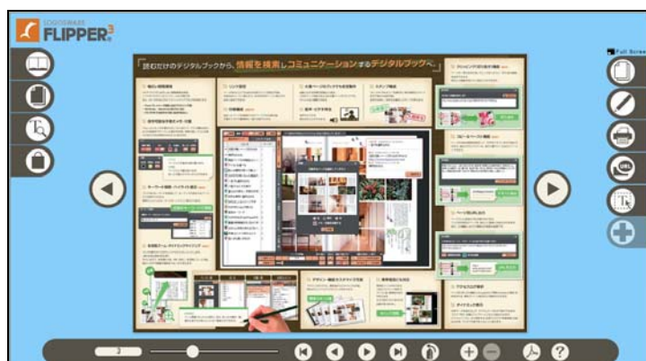
↑ 通常めくり対応スキン(skinrep)

よって、画像差替えとヒントのポップアップのカスタマイズで日本語以外のスキンも作成が可能になります。