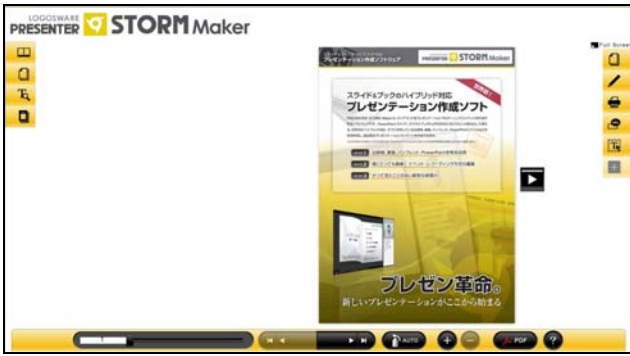
↑ デザインが違うパターン