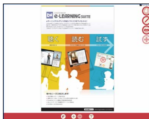
↑ チラシ専用スキン(skinrepc)