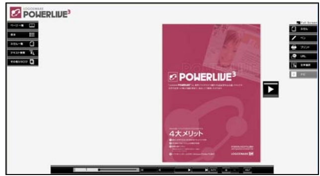
↑ デザインが違うパターン

11種類のデザイン及び一部のデザインには色違いパターンをご用意いたしました。 ダウンロードサイトより画像セットを入手し、ご自由にご使用下さい。